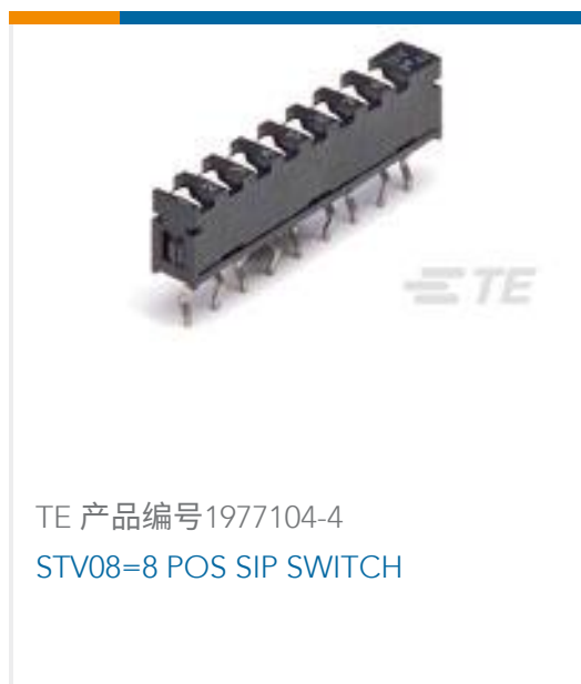
TE 产品编号1977104-4 STV08=8 POS SIP SWITCH