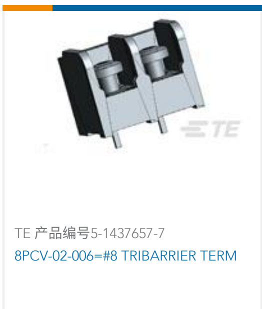
TE 产品编号5-1437657-7 8PCV-02-006=#8 TRIBARRIER TERM