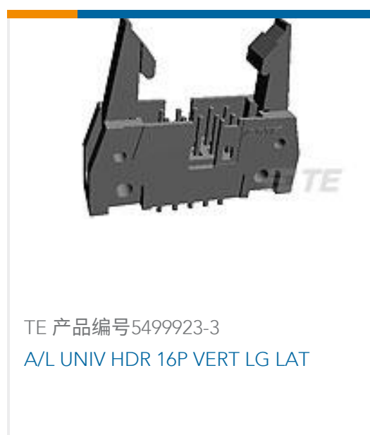
TE 产品编号5499923-3 A/L UNIV HDR 16P VERT LG LAT