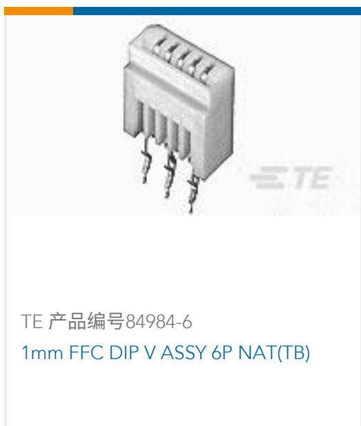
TE 产品编号84984-6 1mm FFC DIP V ASSY 6P NAT(TB)