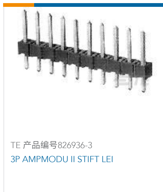
TE 产品编号826936-3 3P AMPMODU II STIFT LEI