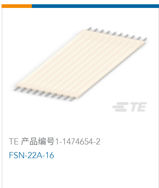
TE 产品编号1-1474654-2 FSN-22A-16