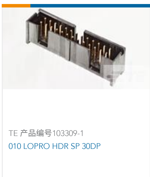
TE 产品编号103309-1 010 LOPRO HDR SP 30DP