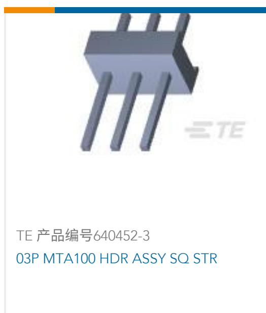
TE 产品编号640452-3 03P MTA100 HDR ASSY SQ STR