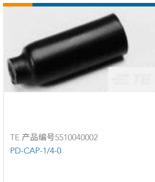
TE 产品编号5510040002 PD-CAP-1/4-0