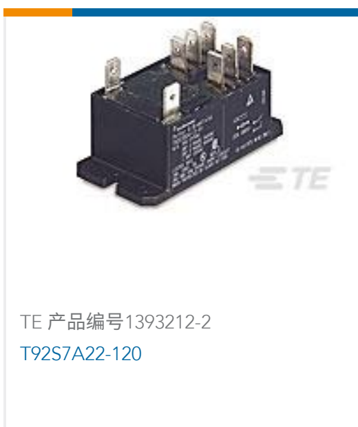
TE 产品编号1393212-2 T92S7A22-120