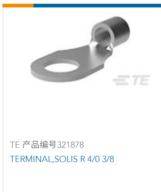
TE 产品编号321878 TERMINAL,SOLIS R 4/0 3/8