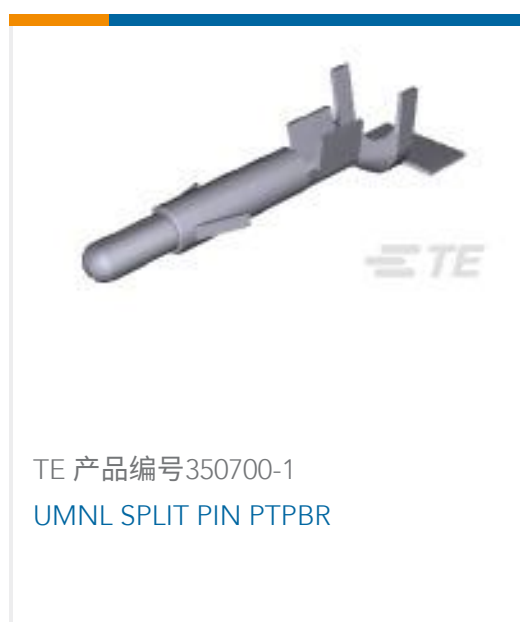
TE 产品编号350700-1 UMNL SPLIT PIN PTPBR