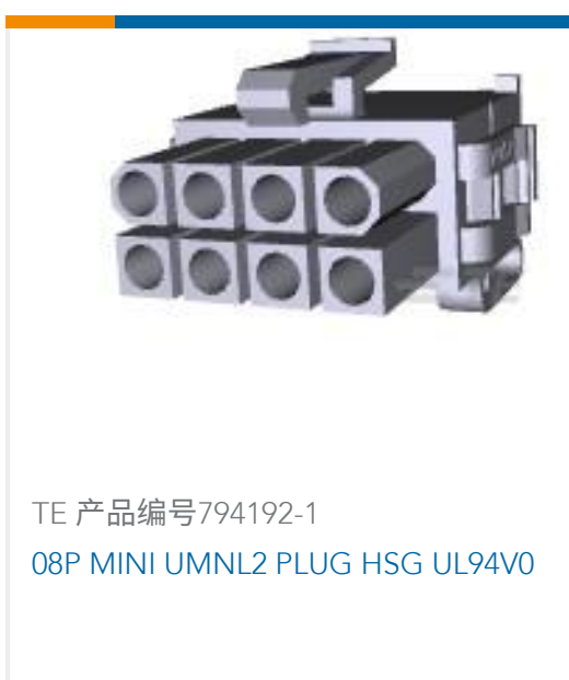
TE 产品编号794192-1 08P MINI UMNL2 PLUG HSG UL94V0