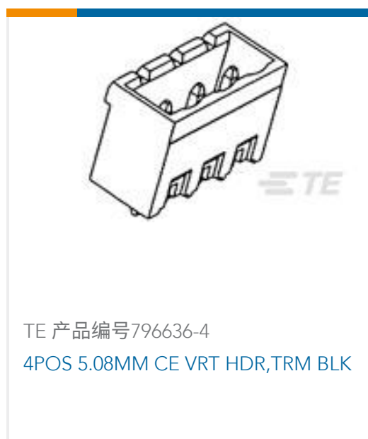
TE 产品编号796636-4 4POS 5.08MM CE VRT HDR,TRM BLK