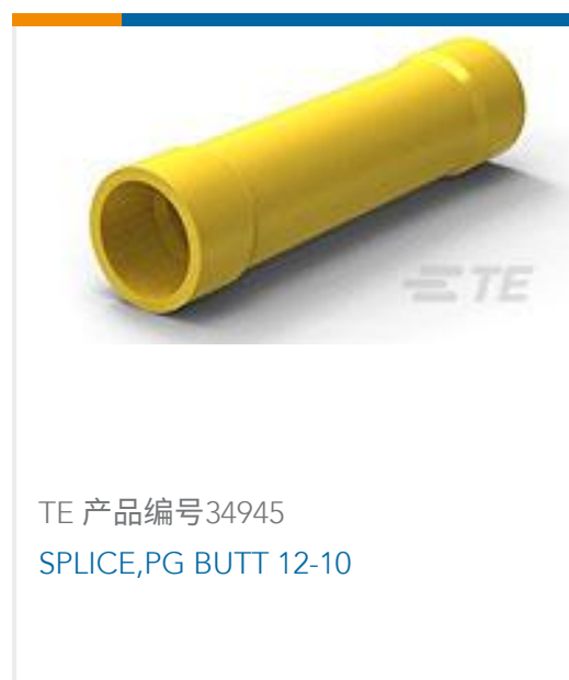
TE 产品编号34945 SPLICE,PG BUTT 12-10