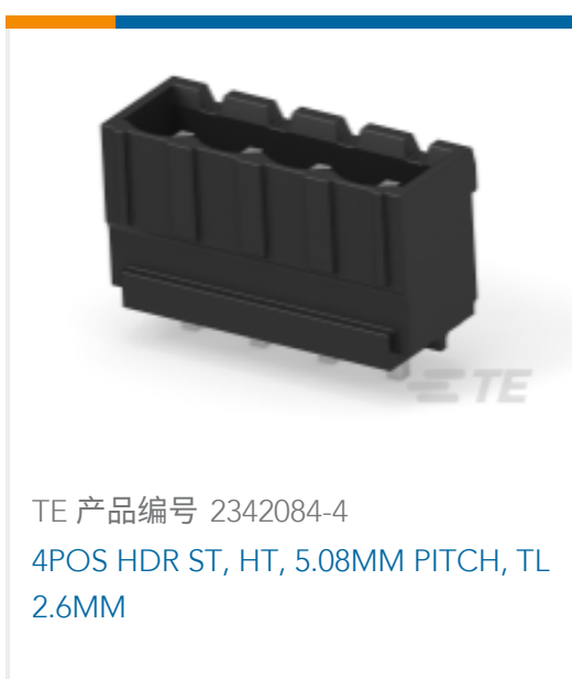
TE 产品编号 2342084-4 4POS HDR ST, HT, 5.08MM PITCH, TL 2.6MM