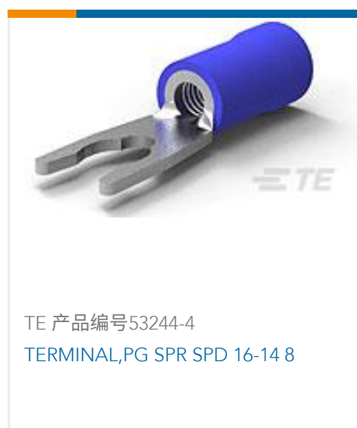
TE 产品编号53244-4 TERMINAL,PG SPR SPD 16-14 8