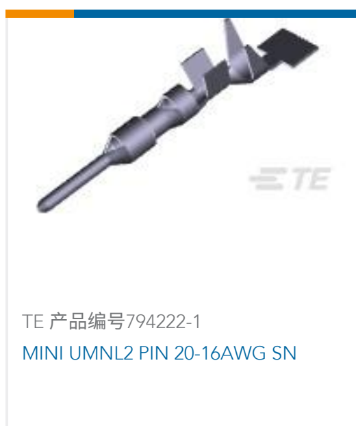
TE 产品编号794222-1 MINI UMNL2 PIN 20-16AWG SN