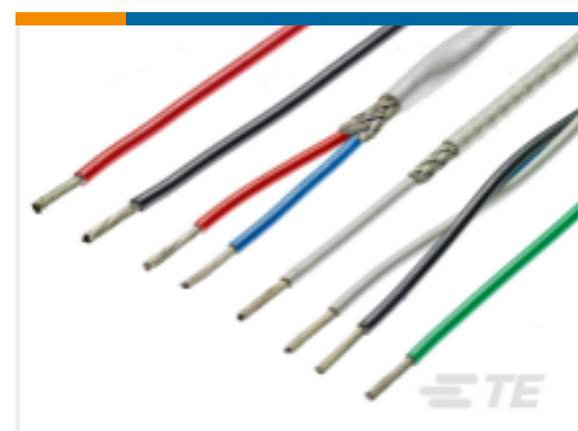
TE 产品编号2611473001 44A0111-12-54