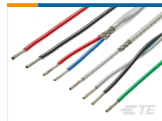
TE 产品编号2823013001 44A0211-8-9