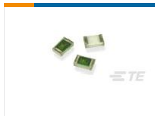
TE 产品编号6-1879127-7 RN 0402 422R 0.1% 10PPM CUT LENGTH