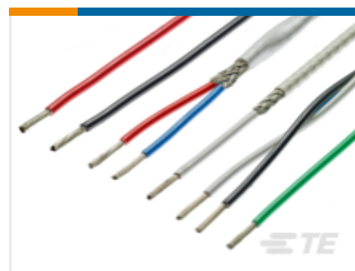
TE 产品编号2611473001 44A0111-12-54