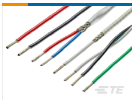
TE 产品编号2611473001 44A0111-12-54