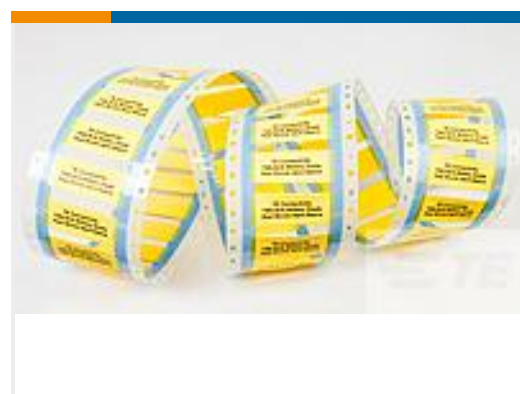
TE 产品编号404545-000 TMS-SCE-1K-3/4-2.0-6