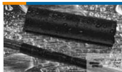
TE 产品编号121397P013 ES2000-NO.3-B8-0-41MM