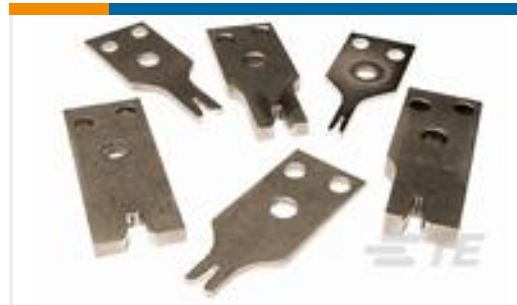
TE 产品编号6-1424909-6 CRIMPER, INSULATION "F"(.240")