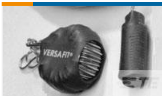
TE 产品编号CZ8200-000 VERSAFIT-3/4-0-2.25IN