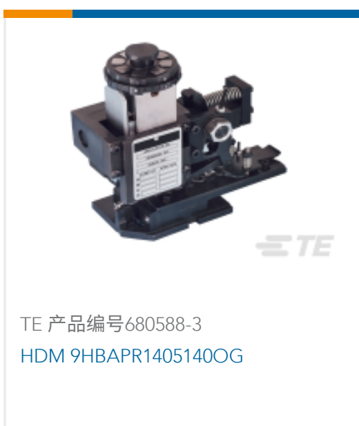
TE 产品编号680588-3 HDM 9HBAPR1405140OG