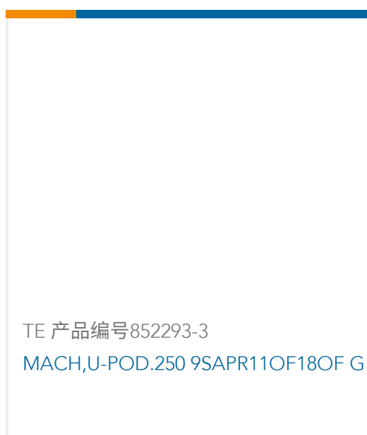
TE 产品编号852293-3 MACH,U-POD.250 9SAPR11OF18OF G