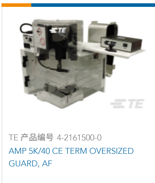
TE 产品编号 4-2161500-0 AMP 5K/40 CE TERM OVERSIZED GUARD, AF