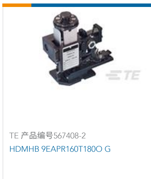
TE 产品编号567408-2 HDMHB 9EAPR160T180O G