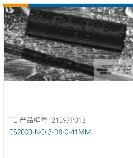
TE 产品编号121397P013 ES2000-NO.3-B8-0-41MM