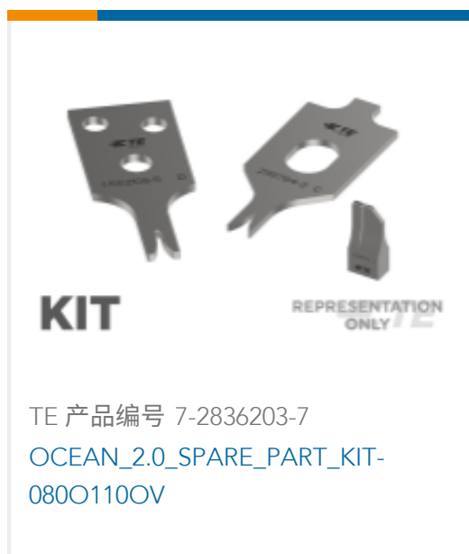
TE 产品编号 7-2836203-7 OCEAN_2.0_SPARE_PART_KIT- 0800110OV