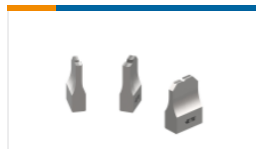
TE 产品编号1-1803060-0 ANVIL, COMBINATION, END FEED