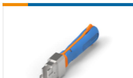
TE 产品编号7-1579028-4 UNLOCKING TOOL 10POL