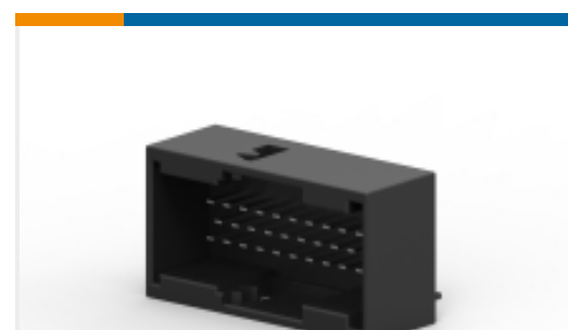
TE 产品编号967387-1 29pos header 180deg PF AP