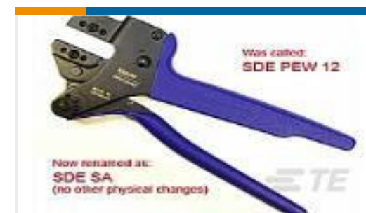
TE 产品编号2063524-1 SDE MCP1.5 0.2-1.0mm2 ASSY