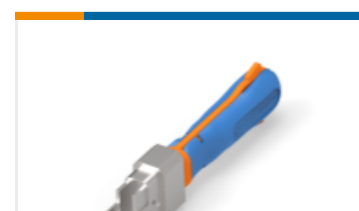
TE 产品编号7-1579028-3 LOCKING TOOL 10POL