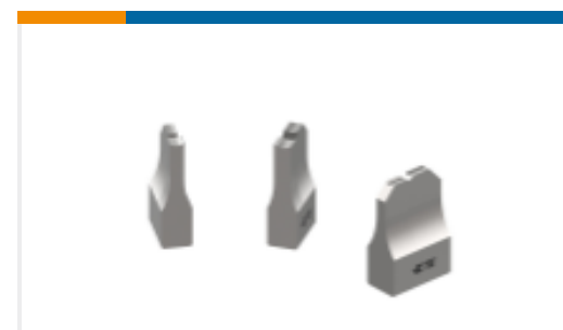
TE 产品编号2-1803074-7 ANVIL, COMBINATION, END FEED