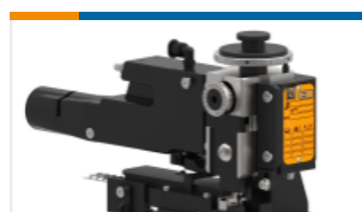
TE 产品编号2266888-2 OC-AT-S-FA-155F220F-059-1104