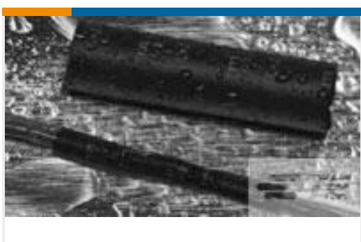
TE 产品编号CX2740-000 ES2000-NO.3-B8-0-130MM