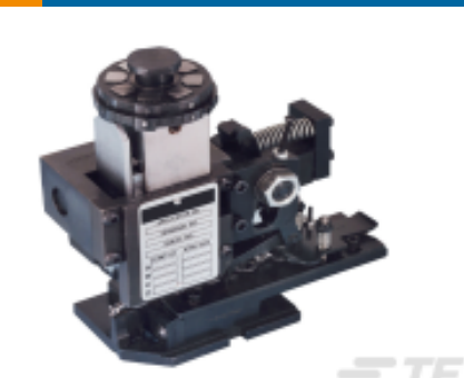
TE 产品编号680588-3 HDM 9HBAPR1405140OG