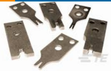
TE 产品编号6-1424909-6 CRIMPER, INSULATION "F"(.240")