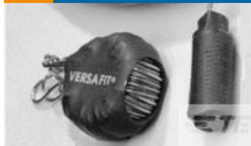
TE 产品编号CZ8200-000 VERSAFIT-3/4-0-2.25IN