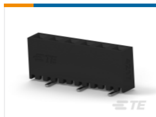
TE 产品编号2307813-6 6P,2MM,BB,REC,SRVT,SMD,0.1AU,TR,W/CP