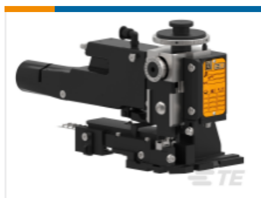
TE 产品编号2266539-2 OC-AT-S-FA-218F402O-023-0699