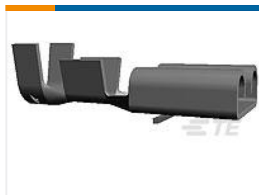
TE 产品编号160811-8 FF 250 REC 4-6MM2 PB