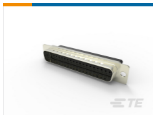
TE 产品编号2334100-4 D-SUB CRIMP MALE 37 POS