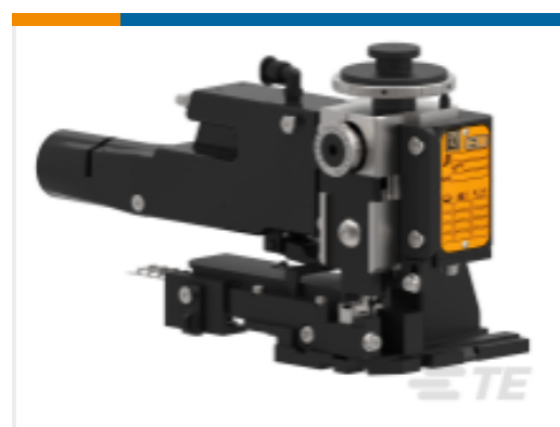
TE 产品编号2836039-2 OC-AT-S-FA-252F303OV-040-0836