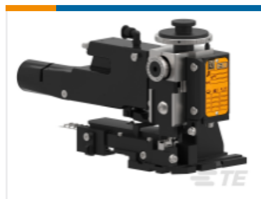
TE 产品编号2837323-2 OCEAN_2.0_Applicator-S-069F125OA