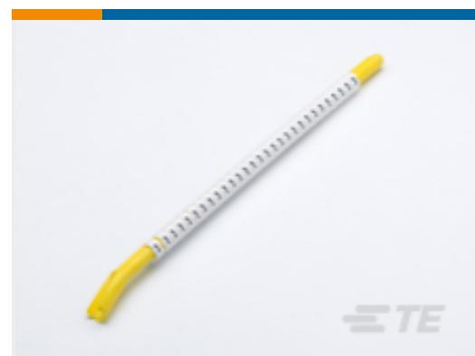
TE 产品编号1-1768041-1 STD Snap-On Markers