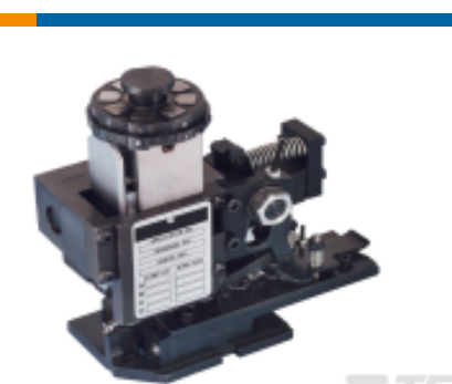
TE 产品编号680588-3 HDM 9HBAPR1405140OG