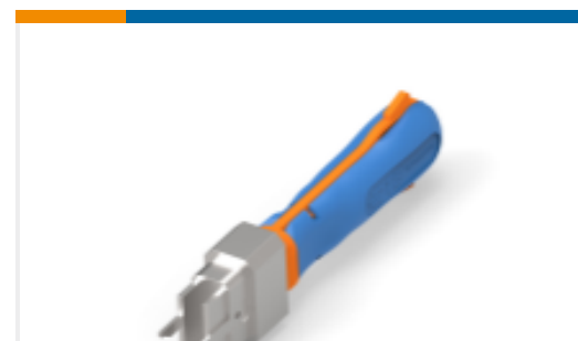
TE 产品编号7-1579028-3 LOCKING TOOL 10POL