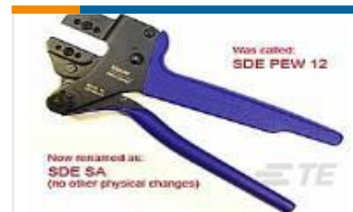
TE 产品编号2063524-1 SDE MCP1.5 0.2-1.0mm2 ASSY