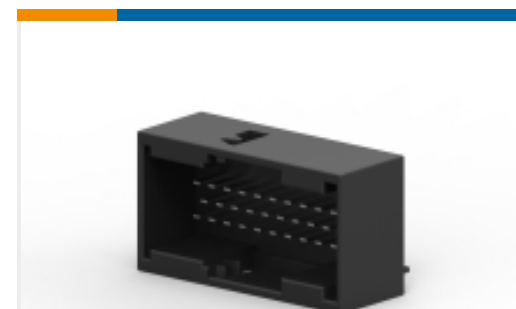
TE 产品编号967387-1 29pos header 180deg PF AP