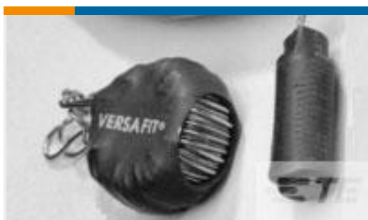
TE 产品编号CU4296-000 VERSAFIT-3X-3/8-0-30MM