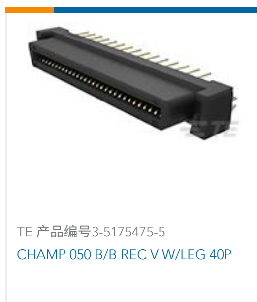
TE 产品编号 3-5175475-5 CHAMP 050 B/B REC V W/LEG 40P