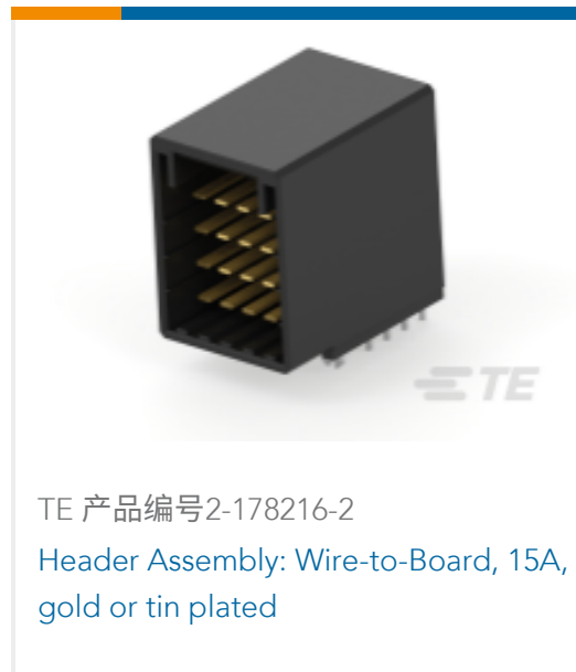
TE 产品编号 2-178216-2 Header Assembly: Wire-to-Board, 15A, gold or tin plated