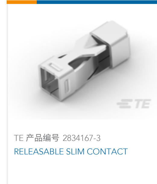
TE 产品编号 2834167-3 RELEASABLE SLIM CONTACT