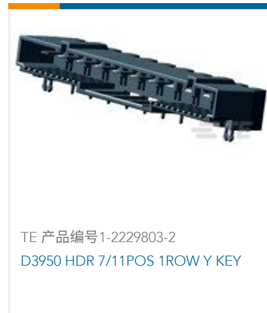
TE 产品编号 1-2229803-2 D3950 HDR 7/11POS 1ROW Y KEY