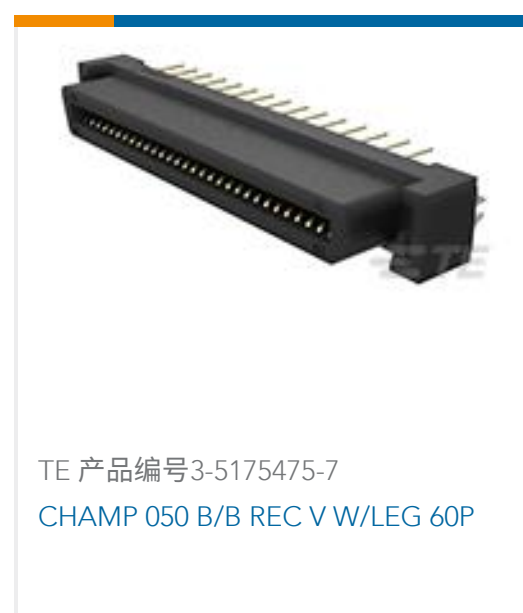
TE 产品编号 3-5175475-7 CHAMP 050 B/B REC V W/LEG 60P