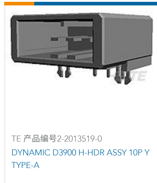
TE 产品编号 2-2013519-0 DYNAMIC D3900 H-HDR ASSY 10P Y TYPE-A