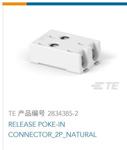
TE 产品编号 2834385-2 RELEASE POKE-IN CONNECTOR_2P_NATURAL