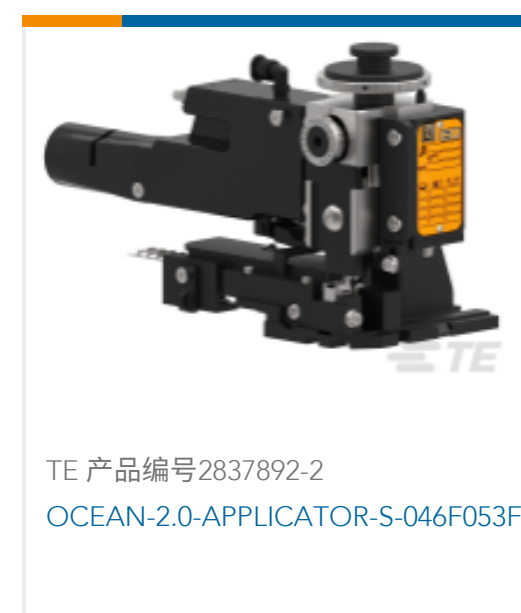
TE 产品编号 2837892-2 OCEAN-2.0-APPLICATOR-S-046F053F