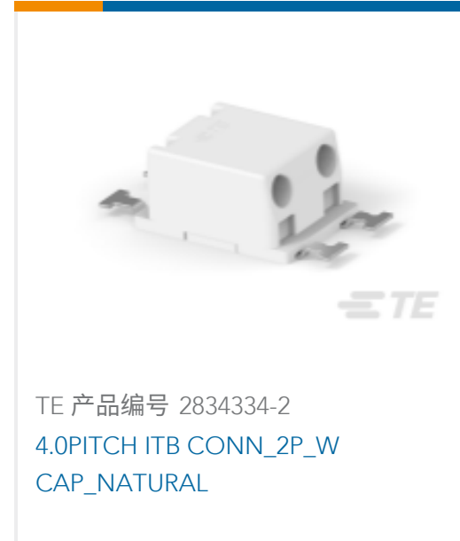
TE 产品编号 2834334-2 4.0PITCH ITB CONN_2P_W CAP_NATURAL