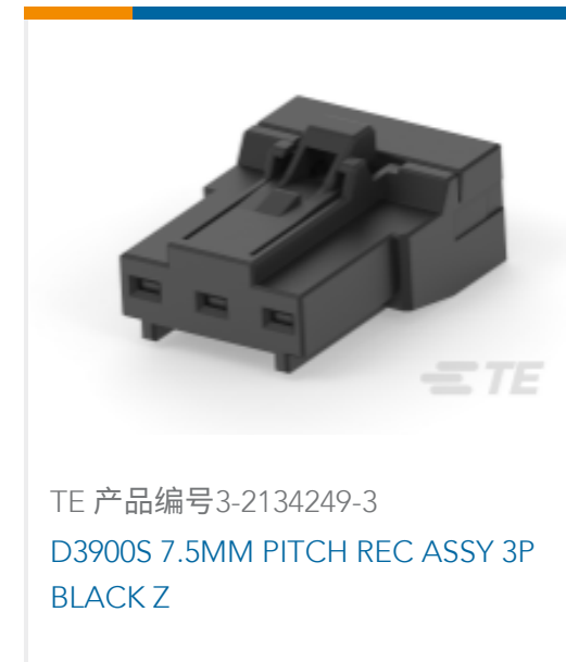
TE 产品编号 3-2134249-3 D3900S 7.5MM PITCH REC ASSY 3P BLACK Z