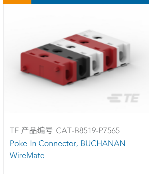
TE 产品编号 CAT-B8519-P7565 Poke-In Connector, BUCHANAN WireMate