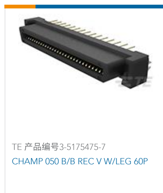
TE 产品编号 3-5175475-7 CHAMP 050 B/B REC V W/LEG 60P