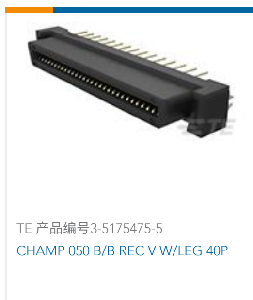
TE 产品编号 3-5175475-5 CHAMP 050 B/B REC V W/LEG 40P