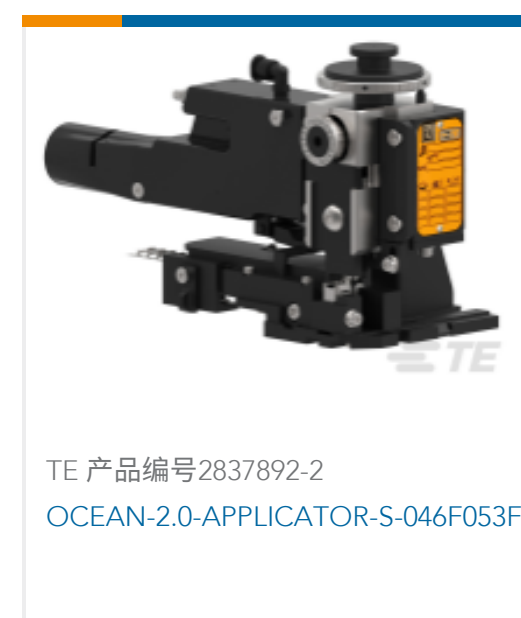
TE 产品编号 2837892-2 OCEAN-2.0-APPLICATOR-S-046F053F