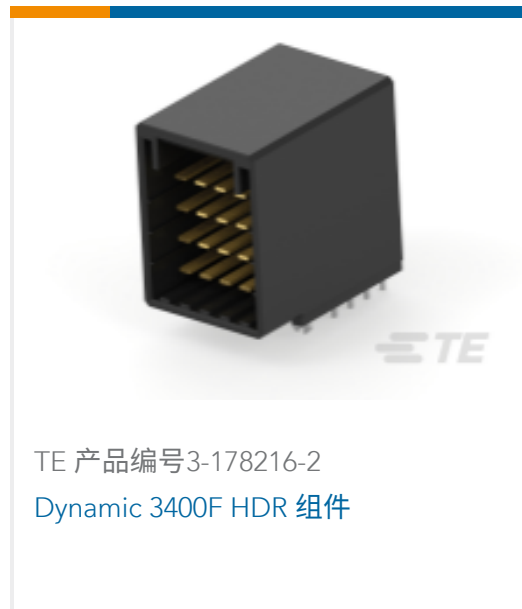
TE 产品编号 3-178216-2 Dynamic 3400F HDR 组件