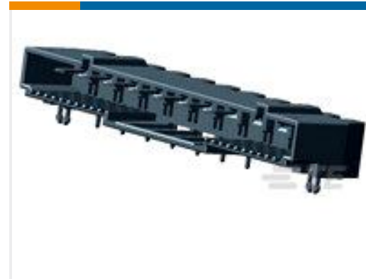
TE 产品编号1-2229803-2 D3950 HDR 7/11POS 1ROW Y KEY