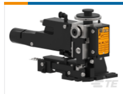
TE 产品编号2837892-2 OCEAN-2.0-APPLICATOR-S-046F053F