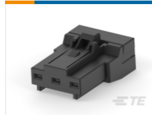
TE 产品编号3-2134249-3 D3900S 7.5MM PITCH REC ASSY 3P BLACK Z