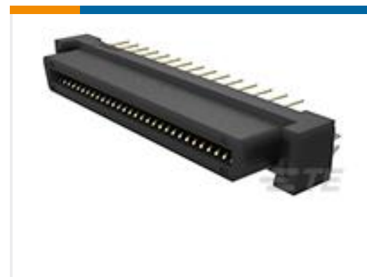
TE 产品编号3-5175475-7 CHAMP 050 B/B REC V W/LEG 60P