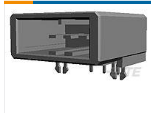
TE 产品编号2-2013519-0 DYNAMIC D3900 H-HDR ASSY 10P Y TYPE-A