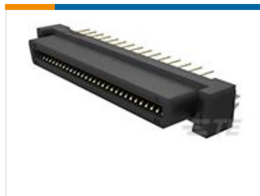
TE 产品编号3-5175475-5 CHAMP 050 B/B REC V W/LEG 40P