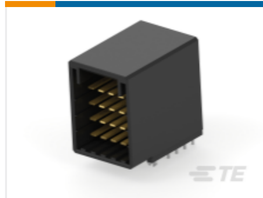
TE 产品编号2-178216-2 Header Assembly: Wire-to-Board, 15A, gold or tin plated