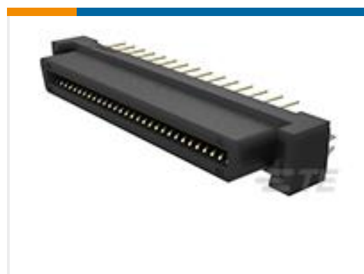
TE 产品编号3-5175475-5 CHAMP 050 B/B REC V W/LEG 40P