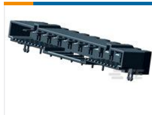
TE 产品编号1-2229803-2 D3950 HDR 7/11POS 1ROW Y KEY