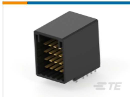
TE 产品编号2-178216-2 Dynamic 3400F HDR 组件