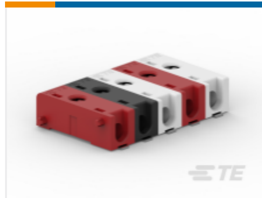
TE 产品编号 CAT-B8519-P7565 Poke-In Connector, BUCHANAN WireMate