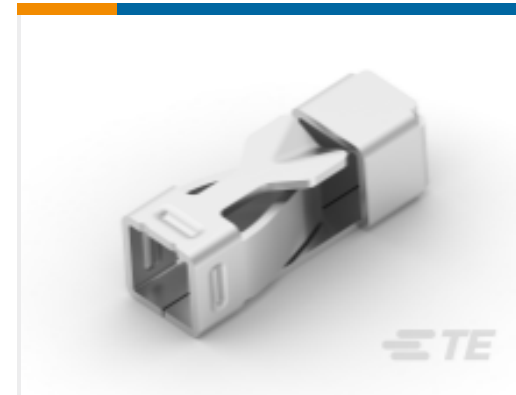
TE 产品编号 2834167-3 RELEASABLE SLIM CONTACT