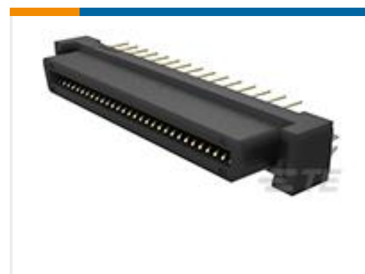
TE 产品编号3-5175475-7 CHAMP 050 B/B REC V W/LEG 60P