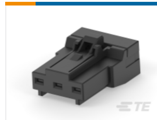
TE 产品编号3-2134249-3 D3900S 7.5MM PITCH REC ASSY 3P BLACK Z