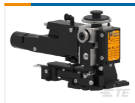
TE 产品编号2837892-2 OCEAN-2.0-APPLICATOR-S-046F053F