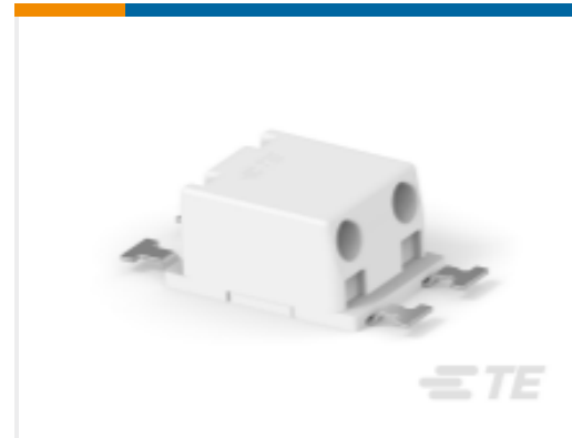
TE 产品编号 2834334-2 4.0PITCH ITB CONN_2P_W CAP_NATURAL