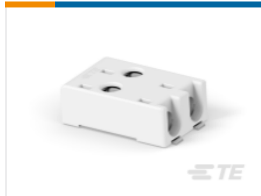
TE 产品编号 2834385-2 RELEASE POKE-IN CONNECTOR_2P_NATURAL