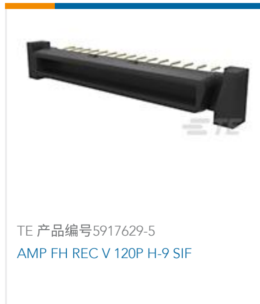
TE 产品编号5917629-5 AMP FH REC V 120P H-9 SIF