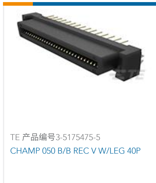
TE 产品编号3-5175475-5 CHAMP 050 B/B REC V W/LEG 40P