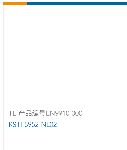
TE 产品编号EN9910-000 RSTI-5952-NL02