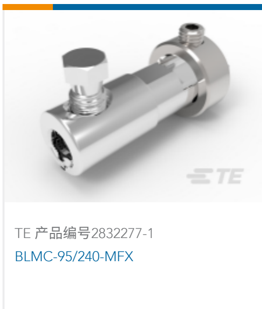
TE 产品编号2832277-1 BLMC-95/240-MFX