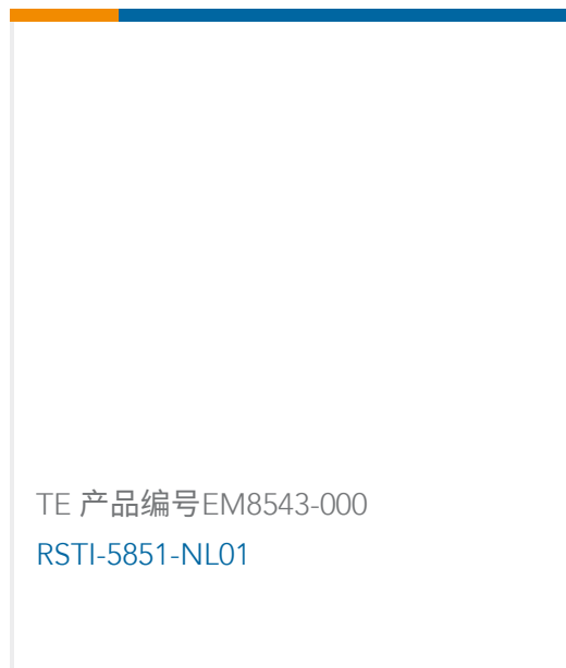
TE 产品编号EM8543-000 RSTI-5851-NL01