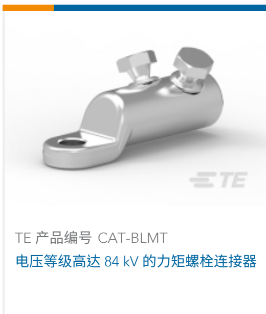
TE 产品编号 CAT-BLMT 电压等级高达 84 kV 的力矩螺栓连接器