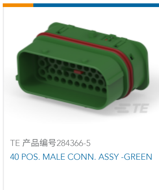
TE 产品编号284366-5 40 POS. MALE CONN. ASSY -GREEN