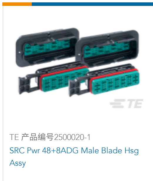
TE 产品编号2500020-1 SRC Pwr 48+8ADG Male Blade Hsg Assy