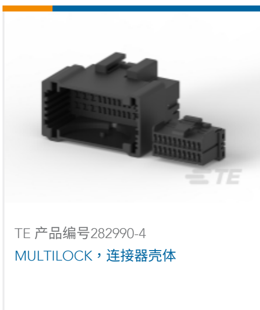
TE 产品编号282990-4 MULTILOCK, 连接器壳体