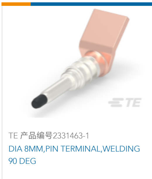
TE 产品编号2331463-1 DIA 8MM,PIN TERMINAL,WELDING 90 DEG