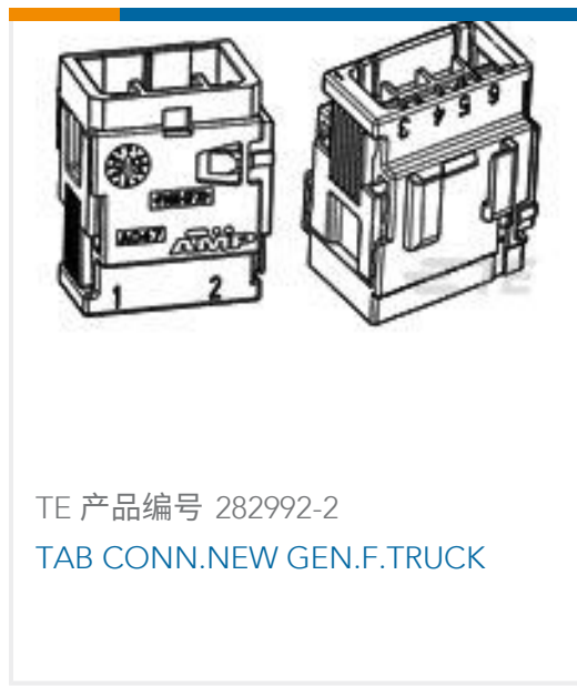
TE 产品编号 282992-2 TAB CONN.NEW GEN.F.TRUCK