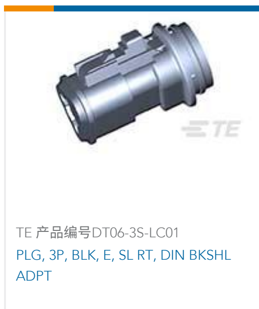
TE 产品编号DT06-3S-LC01 PLG, 3P, BLK, E, SL RT, DIN BKSHL ADPT