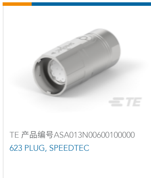
TE 产品编号ASA013N00600100000 623 PLUG, SPEEDTEC