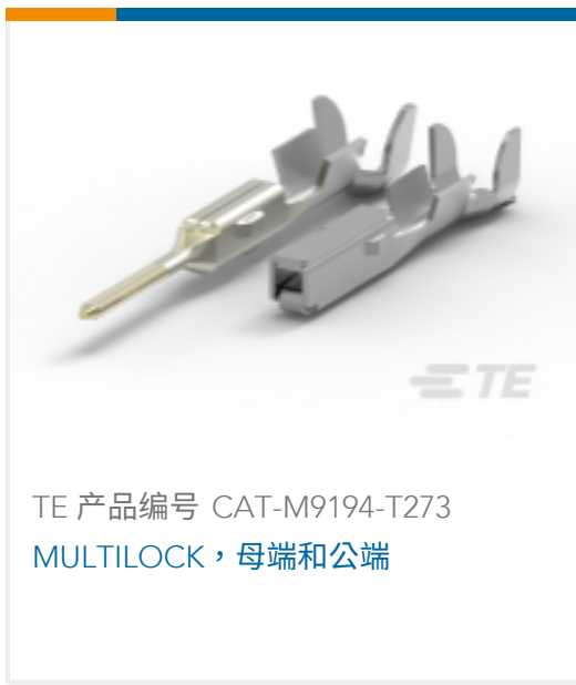
TE 产品编号 CAT-M9194-T273 MULTILOCK, 母端和公端