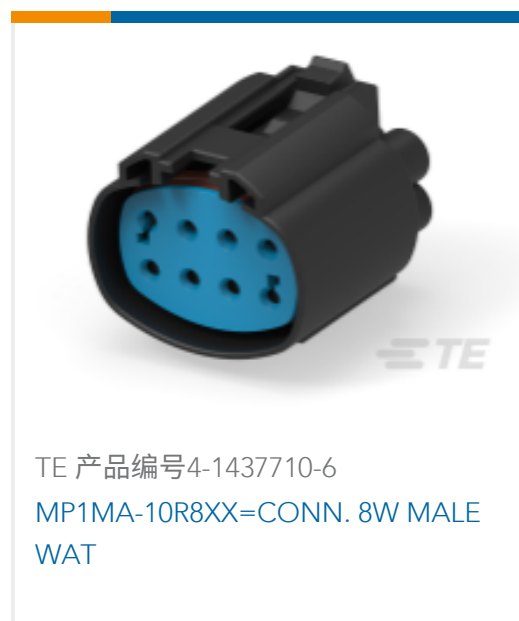
TE 产品编号4-1437710-6 MP1MA-10R8XX=CONN. 8W MALE WAT