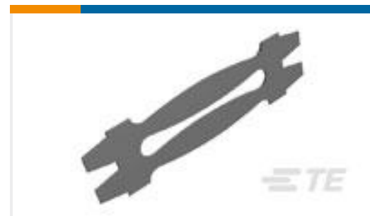
TE 产品编号192007-7 LA1AS .006 SIL PL