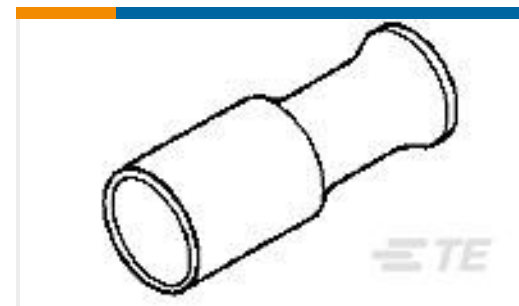
TE 产品编号330478 FERRULE