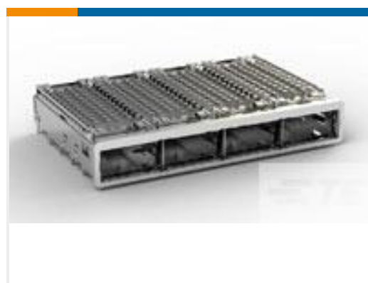
TE 产品编号 2007625-1 1x4 QSFP Kit Assy Bhd Bzl, PCI