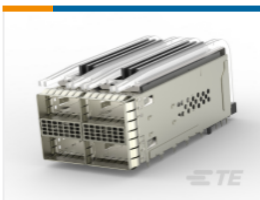
TE 产品编号 2299870-1 THERMAL QSFP+ STACKED REC ASSEMBLY 2X2