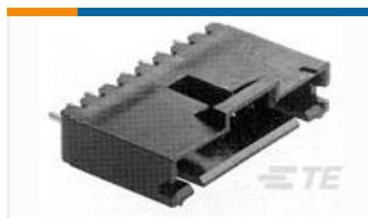
TE 产品编号5-104363-7 08 MTE HDR SRST LATCH .100CL