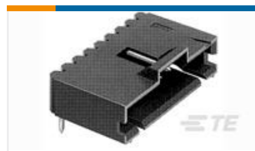
TE 产品编号103635-1 02 MTE HDR SRRA LATCH .100CL