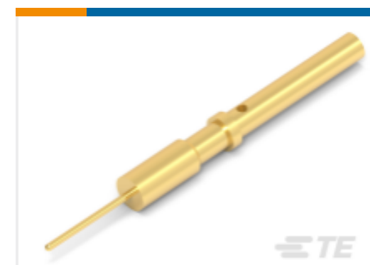
TE 产品编号1648358-1 708-0130-01109