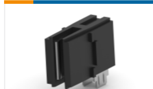
TE 产品编号2178517-2 CROWN CLIP JUNIOR BUSBAR CONN