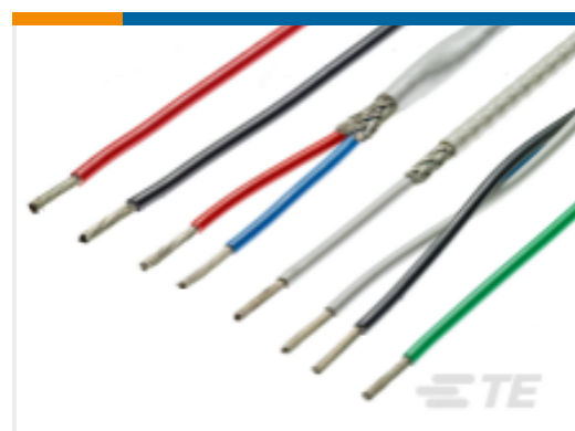
TE 产品编号2611473001 44A0111-12-54