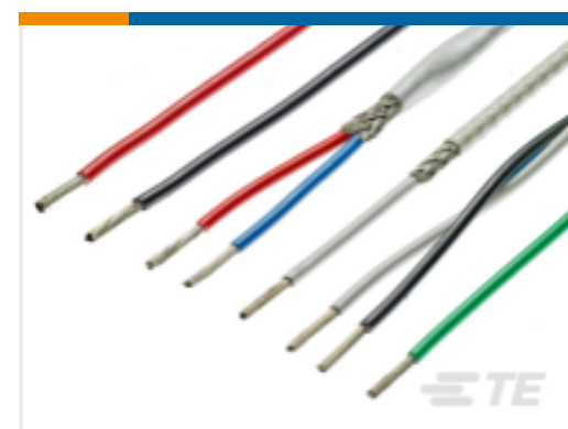
TE 产品编号2823013001 44A0211-8-9