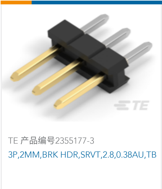
TE 产品编号2355177-3 3P,2MM,BRK HDR,SRVT,2.8,0.38AU,TB