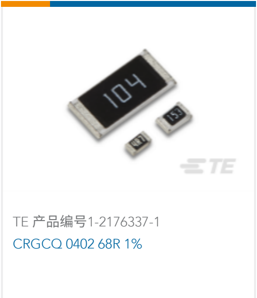
TE 产品编号1-2176337-1 CRGCQ 0402 68R 1%