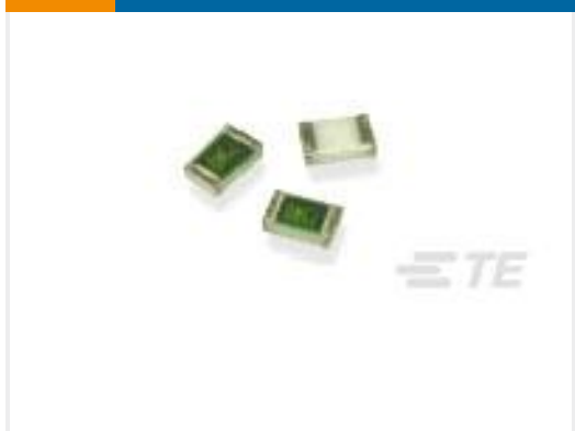
TE 产品编号6-1879127-7 RN 0402 422R 0.1% 10PPM CUT LENGTH