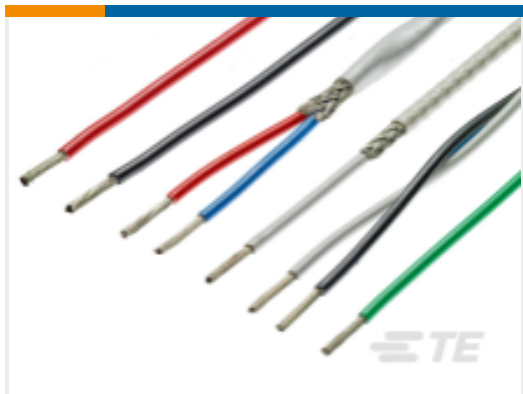
TE 产品编号2823013001 44A0211-8-9