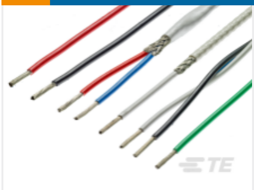
TE 产品编号2611473001 44A0111-12-54