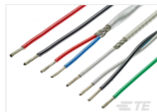
TE 产品编号2823013001 44A0211-8-9