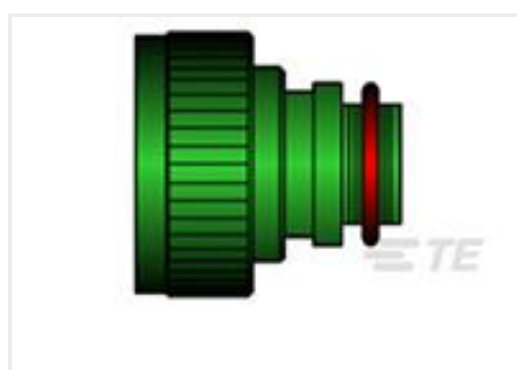
TE 产品编号CV0170-000 TXR40AZ00-2012AI