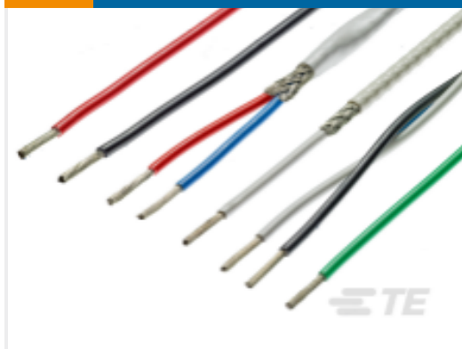
TE 产品编号 2823013001 44A0211-8-9