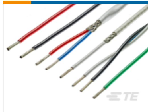
TE 产品编号 2611473001 44A0111-12-54