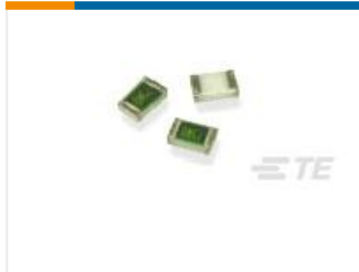
TE 产品编号 6-1879127-7 RN 0402 422R 0.1% 10PPM CUT LENGTH