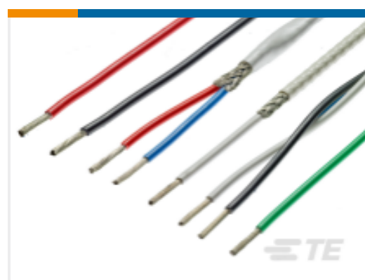
TE 产品编号2611473001 44A0111-12-54