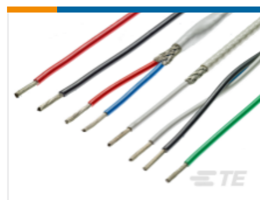
TE 产品编号2823013001 44A0211-8-9