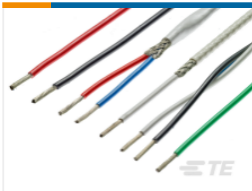
TE 产品编号2823013001 44A0211-8-9