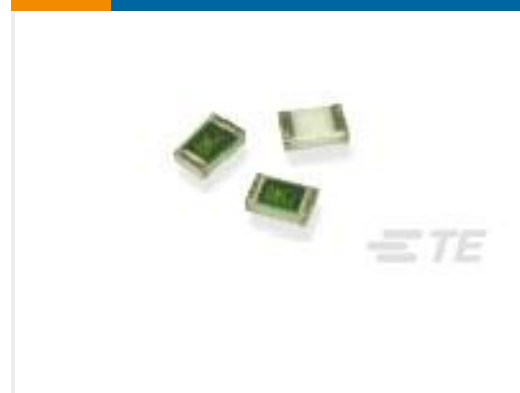
TE 产品编号6-1879127-7 RN 0402 422R 0.1% 10PPM CUT LENGTH