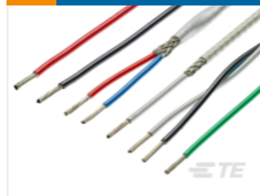
TE 产品编号2611473001 44A0111-12-54