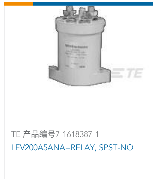
TE 产品编号7-1618387-1 LEV200A5ANA=RELAY, SPST-NO