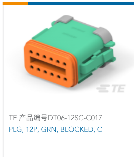
TE 产品编号DT06-12SC-C017 PLG, 12P, GRN, BLOCKED, C