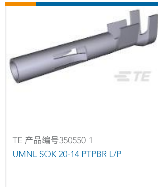
TE 产品编号350550-1 UMNL SOK 20-14 PTPBR L/P