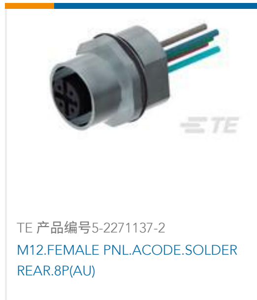
TE 产品编号5-2271137-2 M12.FEMALE PNL.AC CODE.SOLDER REAR.8P(AU)