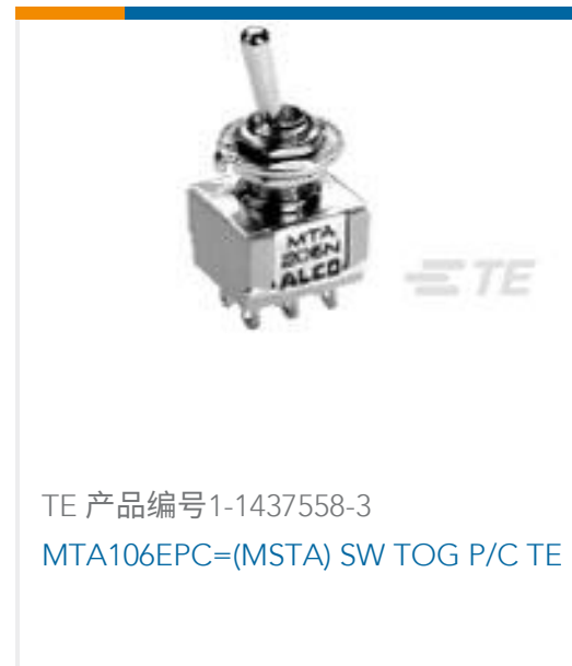
TE 产品编号1-1437558-3 MTA106EPC=(MSTA) SW TOG P/C TE