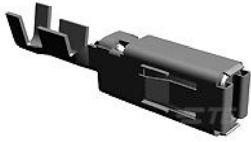
TE 产品编号1-968849-3 AMP MCP 2.8, CONTACT