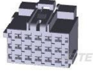
TE 产品编号1-967623-6 JUN-POW-TIM GEH 15P