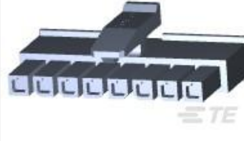
TE 产品编号1445022-8 MICRO MNL RFECEPT HSG SINGLE R