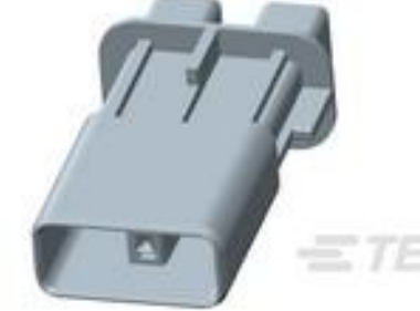
TE 产品编号2103245-5 Inner Housing, Split Hdr, Key E, HVA280