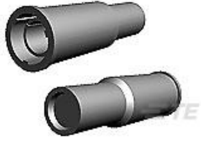
TE 产品编号165399-1 SHUR PLUG REC.ASSY.