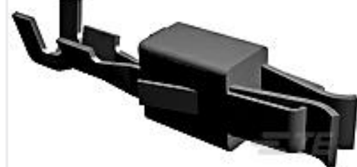
TE 产品编号927780-1 JUNIOR-TIMER CONTACT