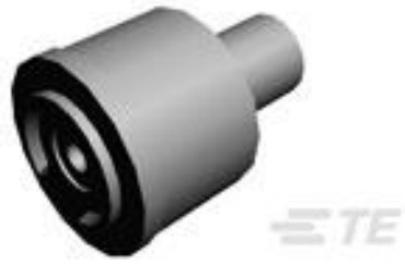
TE 产品编号284863-1 SINGLE WIRE SEAL F.EXT.INS.DIA