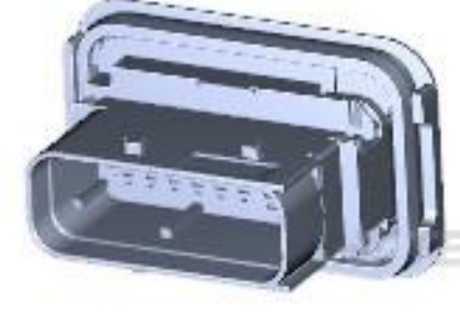
TE 产品编号1-1564407-1 16POS, MIXED,TAB HSG,ASSY,CODA