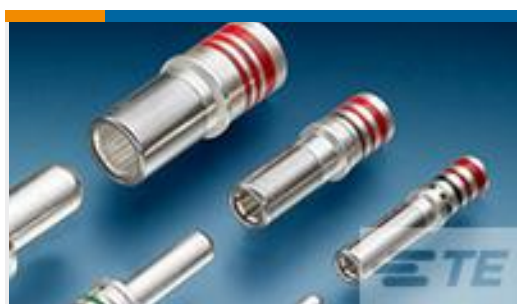
TE 产品编号 0662-207-0882 CONT SOC ASSY