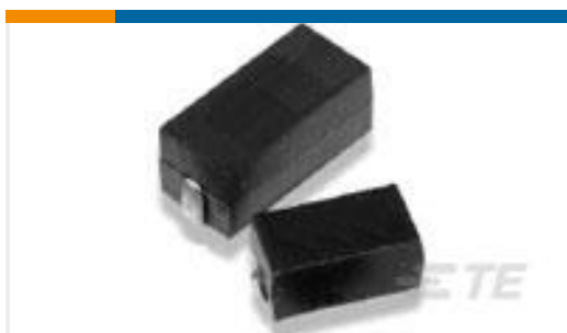
TE 产品编号8-1879021-3 SMW3 270R 5%