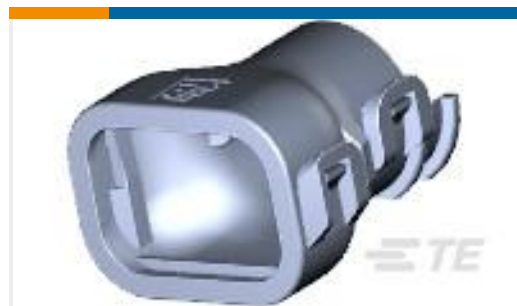
TE 产品编号1670364-1 COVER,180 GROUP C