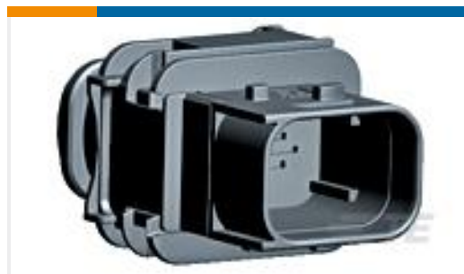
TE 产品编号1-1564544-1 2POS,TAB 5.8X0.8,TAB HSG,ASSY