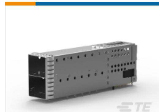
TE 产品编号 2296273-1 MICROQSFP 2X1 CAGE ASSY EMI SPRING