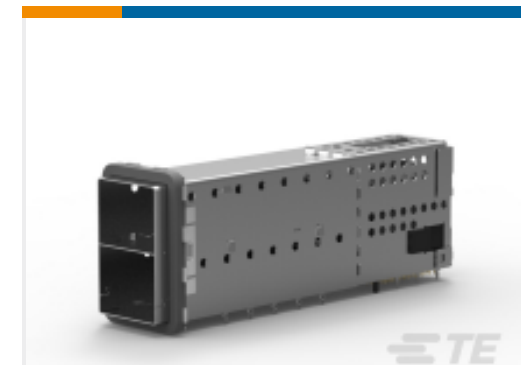
TE 产品编号 2296273-2 MICROQSFP 2X1 CAGE ASSY EMI GASKET