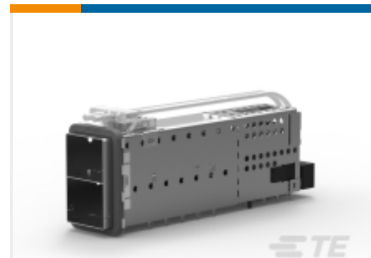
TE 产品编号 2-2296273-2 MICROQSFP 2X1 CAGE ASSY EMI GASKET, 2LP