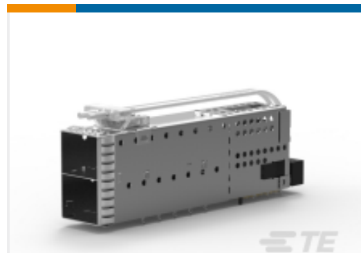
TE 产品编号 2-2296273-1 MICROQSFP 2X1 CAGE ASSY EMI SPRING, 2LP