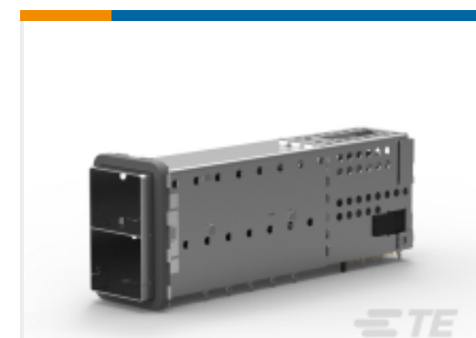
TE 产品编号 2296273-2 MICROQSFP 2X1 CAGE ASSY EMI GASKET