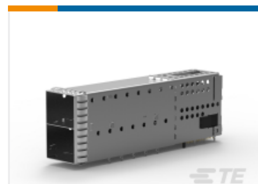
TE 产品编号 2296273-1 MICROQSFP 2X1 CAGE ASSY EMI SPRING