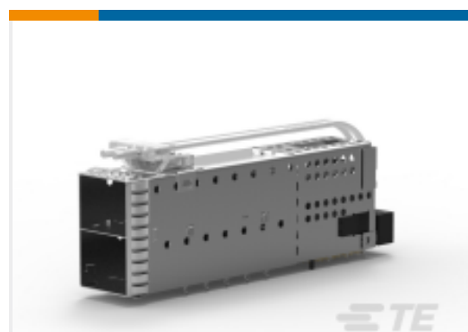
TE 产品编号 2-2296273-1 MICROQSFP 2X1 CAGE ASSY EMI SPRING, 2LP