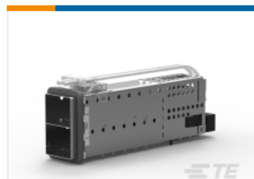
TE 产品编号 2-2296273-2 MICROQSFP 2X1 CAGE ASSY EMI GASKET, 2LP