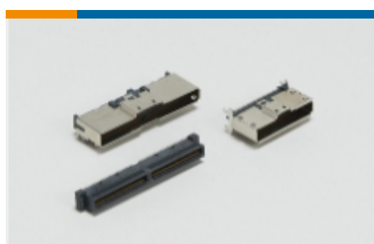
内部 I/O 连接器(133)