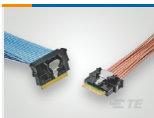
TE 产品编号2821745-1 SLIVER C/A, 74P, R/A TO R/A, 25GHZ 85OHM