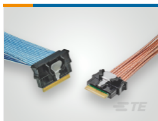
TE 产品编号2821376-1 SLIVER C/A, 74P, STR TO STR, 25GHZ 85OHM