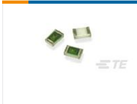
TE 产品编号6-1879127-7 RN 0402 422R 0.1% 10PPM CUT LENGTH