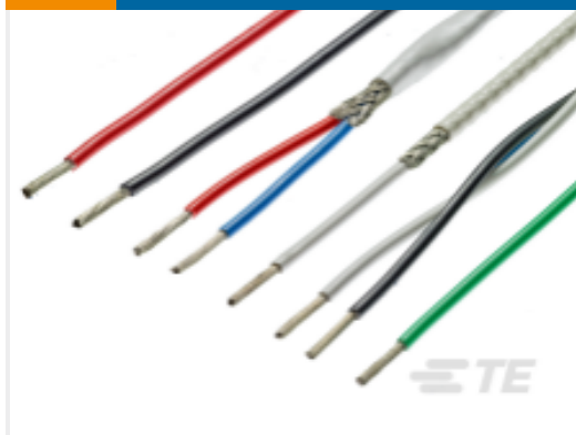
TE 产品编号2823013001 44A0211-8-9