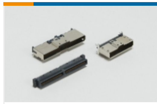
内部 I/O 连接器(133)