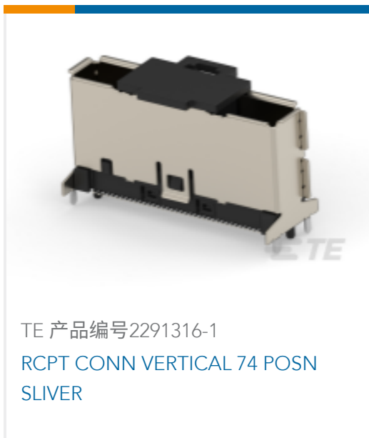
TE 产品编号2291316-1 RCPT CONN VERTICAL 74 POSN SILVER