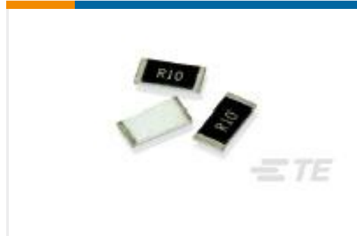
TE 产品编号2176049-4 RLP73M 1E R068 1% 1K RL