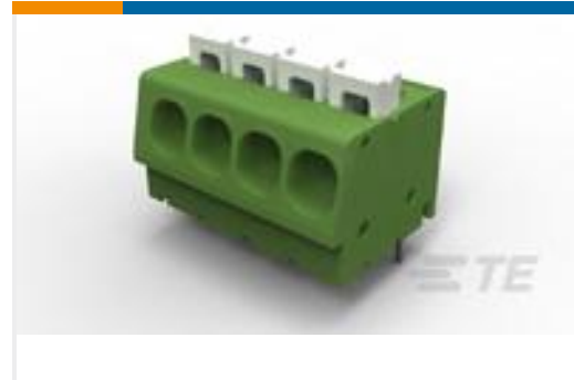
TE 产品编号1-1986711-8 SCREWLESS, SW,18P,5.0 PCB