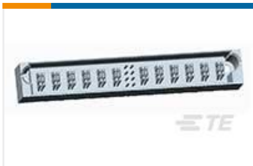
TE 产品编号1-6450820-5 MBXLE VERT HDR 6P20S