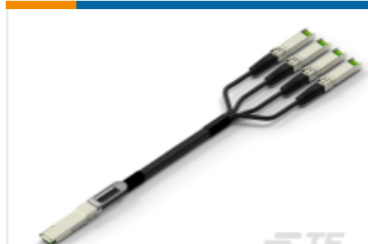
TE 产品编号4-2334878-4 QSFP TO [4]SFP 56GIG 26AWG 2 METER