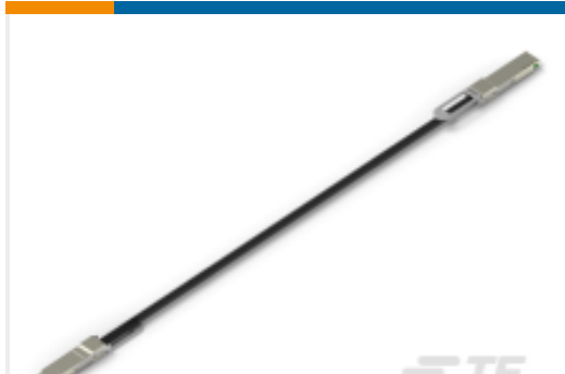
TE 产品编号4-2333842-4 26 AWG QSFP56 对 QSFP56 电缆组件