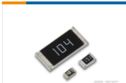
TE 产品编号5-2176347-7 CRGCCQ 2010 470K 1%