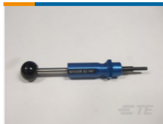
TE 产品编号992024-000 AD-1447-CONT-REMOVAL-TOOL