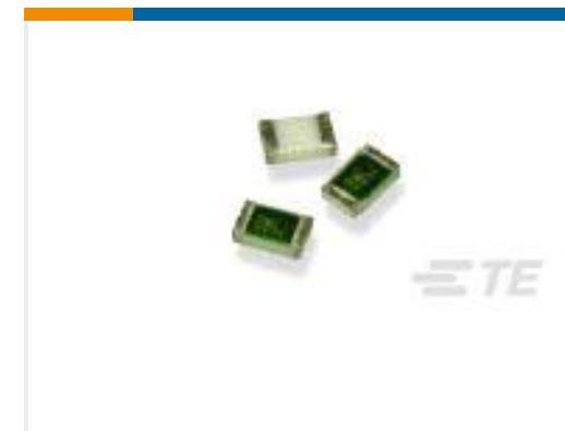
TE 产品编号3-1879213-3 CPF 0402 56R2 0.1% 25PPM 1K RL