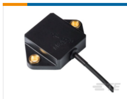
TE 产品编号 CAT-TSI0020 AXISENSE-2 Dual Axis Tilt Sensors