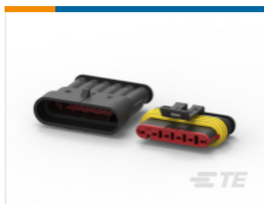
TE 产品编号 CAT-AM71-CH8172 AMP SUPERSEAL 1.5MM，连接器壳体