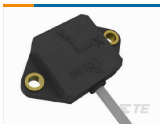
TE 产品编号 CAT-TSI0007 AXISENSE-2 V-OUT 倾角传感器落地式安装