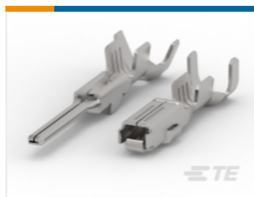
TE 产品编号 CAT-AM71-T273 AMP SUPERSEAL 1.5MM，母端和公端