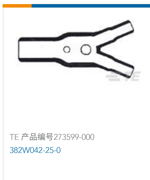
TE 产品编号273599-000 382W042-25-0