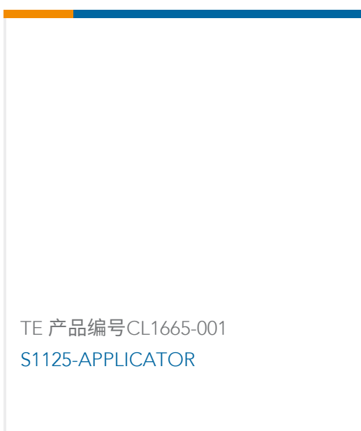
TE 产品编号CL1665-001 S1125-APPLICATOR