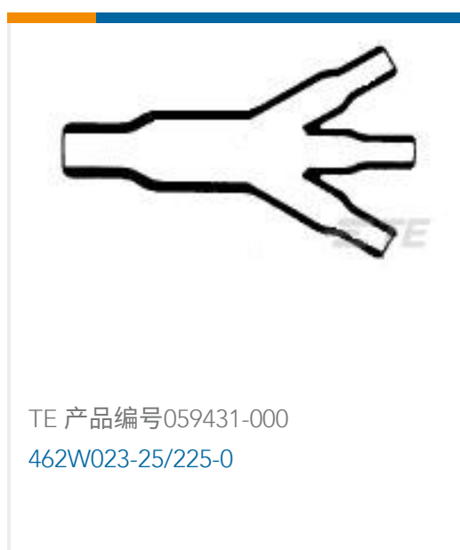
TE 产品编号059431-000 462W023-25/225-0