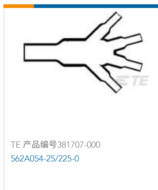
TE 产品编号381707-000 562A054-25/225-0