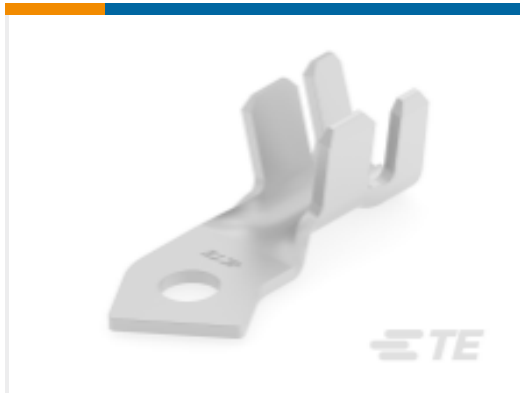
TE 产品编号2819152-3 TERMINAL RING TONGUE M8