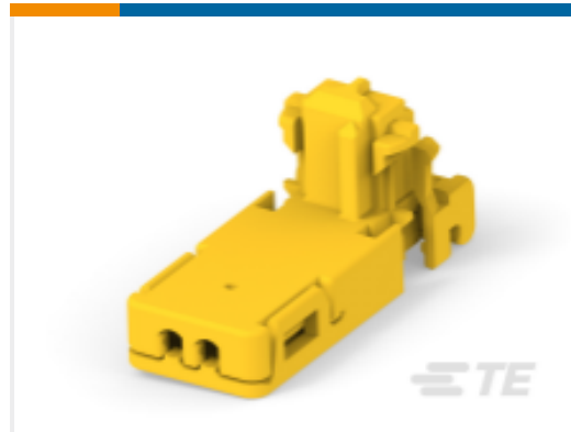
TE 产品编号1612120-4 11DIA SQUIB SLIM MK-2 PLUG HSG