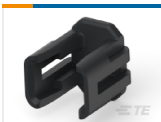
TE 产品编号2133533-1 COVER 90 DEGREES