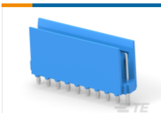
TE 产品编号281695-5 HE13/HE14 TH 接头, SRST