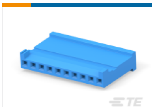
TE 产品编号281838-8 HE13/HE14 压接外壳