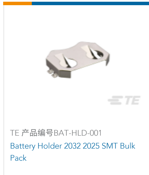
TE 产品编号BAT-HLD-001 Battery Holder 2032 2025 SMT Bulk Pack