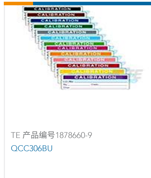
TE 产品编号1878660-9 QCC306BU