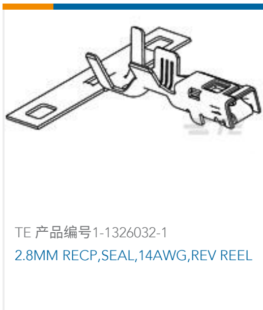
TE 产品编号1-1326032-1 2.8MM RECP,SEAL,14AWG,REV REEL