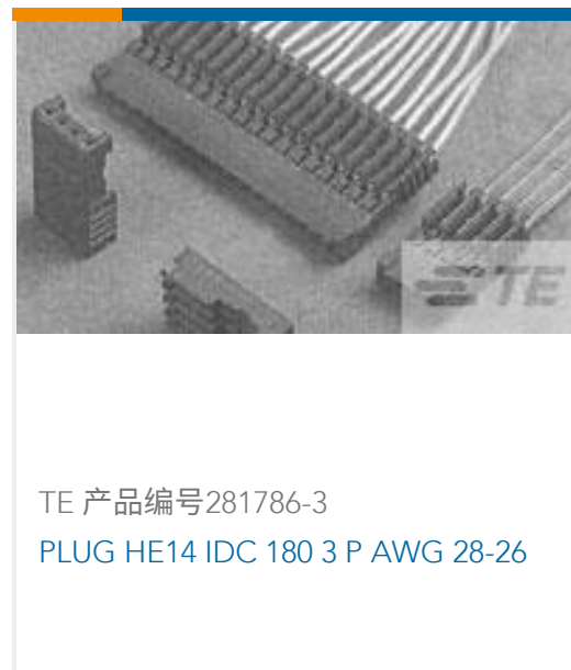
TE 产品编号281786-3 PLUG HE14 IDC 180 3 P AWG 28-26