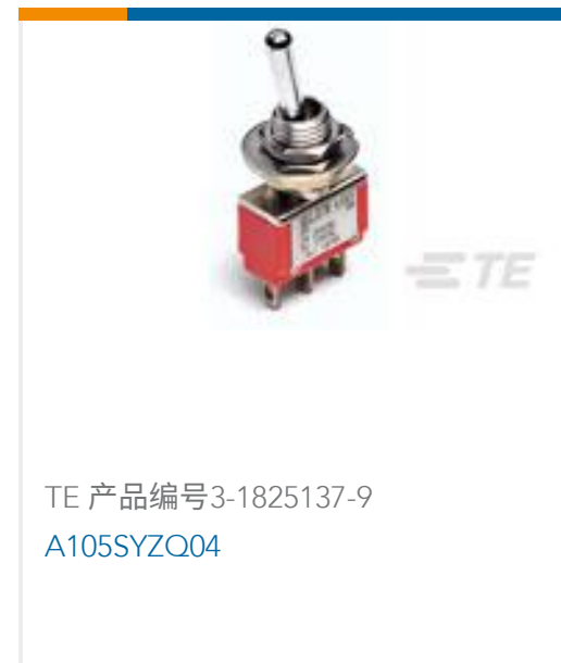
TE 产品编号3-1825137-9 A105SYZQ04