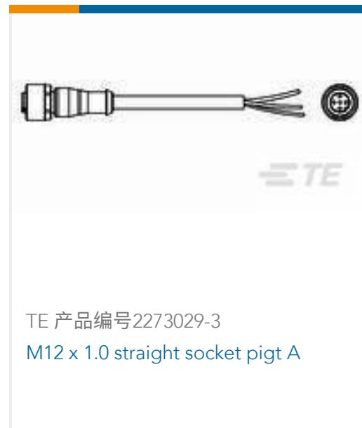
TE 产品编号2273029-3 M12 x 1.0 straight socket pigt A