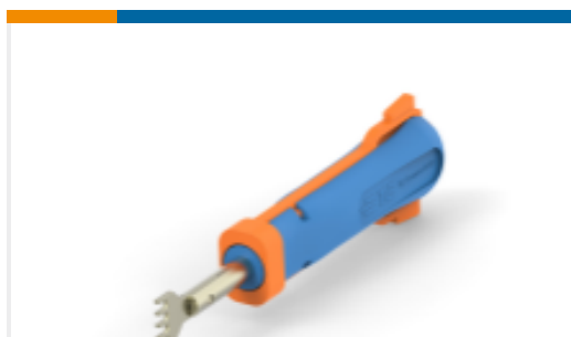
TE 产品编号 8-1579007-7 EXTRACTION TOOL