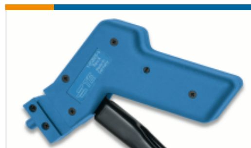
TE 产品编号 1-528015-6 PISTOL GRIP HANDLE