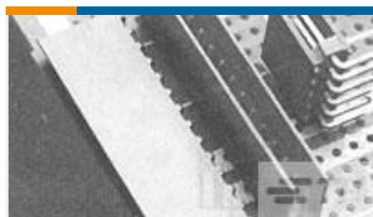
TE 产品编号 281699-5 HEADER HE13 RA 5 P