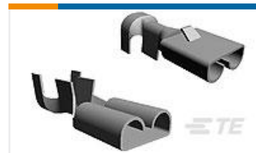
TE 产品编号6-160526-2 FF 250 REC 0.5-1.5MM2 TPPB