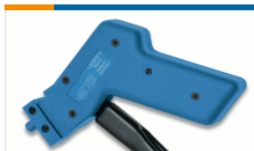
TE 产品编号 1-528015-6 PISTOL GRIP HANDLE