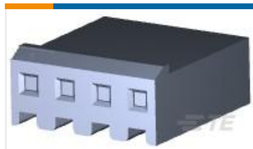
TE 产品编号640250-4 04P SL156 HSG W/LCK RAMP NATL