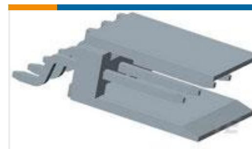
TE 产品编号 953820-1 HEADER HE13 SMT 4 P TAPE PACKAGING