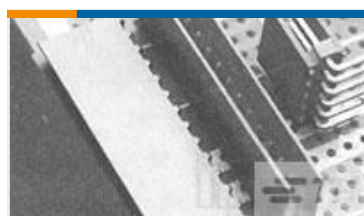
TE 产品编号 953820-2 HEADER HE13 SMT 4 P BULK PACKAGING