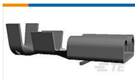
TE 产品编号5-160446-6 FF 250 REC 1.0-2.5MM2 BR SILVER PLATED