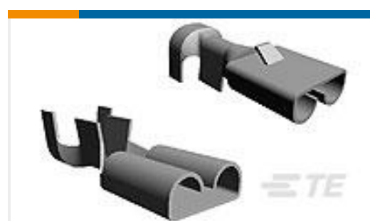
TE 产品编号6-160448-2 FF 250 REC 1.0-2.5MM2 TPPB