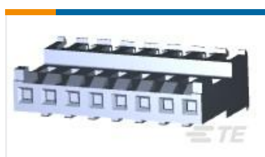
TE 产品编号3-644466-8 08P MTA156 CONN ASSY 20AWG YEL