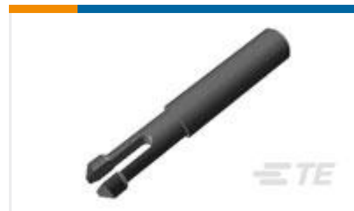
TE 产品编号1-640415-1 UMNL KEYING PLUG V2 NATL