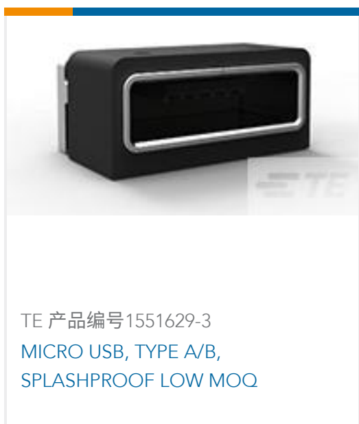
TE 产品编号1551629-3 MICRO USB, TYPE A/B, SPLASHPROOF LOW MOQ