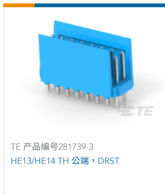
TE 产品编号281739-3 HE13/HE14 TH 公端, DRST