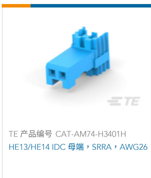
TE 产品编号 CAT-AM74-H3401H HE13/HE14 IDC 母端, SRRA, AWG26