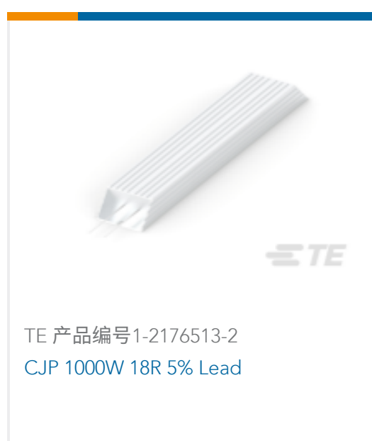
TE 产品编号1-2176513-2 CJP 1000W 18R 5% Lead