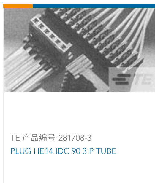
TE 产品编号 281708-3 PLUG HE14 IDC 90 3 P TUBE