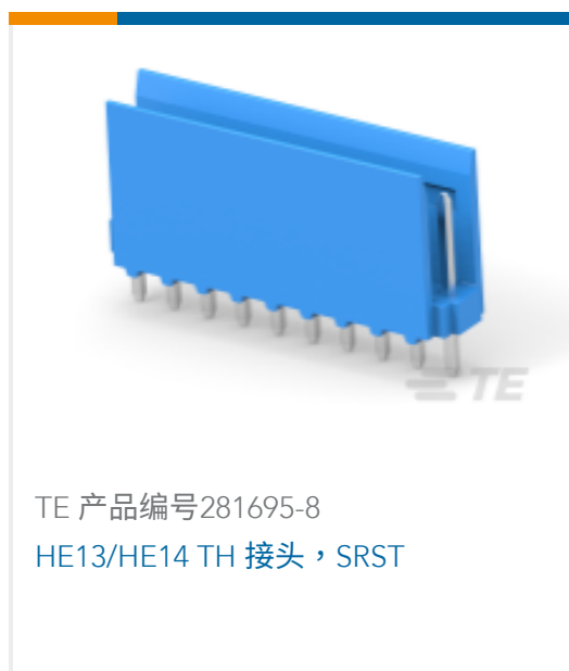
TE 产品编号281695-8 HE13/HE14 TH 接头, SRST