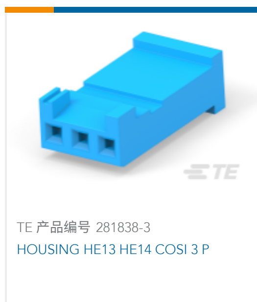
TE 产品编号 281838-3 HOUSING HE13 HE14 COSI 3 P