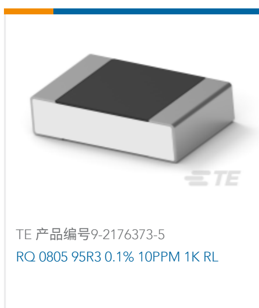
TE 产品编号9-2176373-5 RQ 0805 95R3 0.1% 10PPM 1K RL