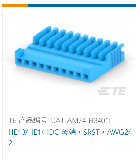
TE 产品编号 CAT-AM74-H3401I HE13/HE14 IDC 母端, SRST, AWG24-2