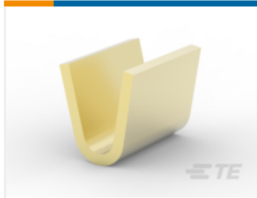
TE 产品编号 280002-1 AMPLIVAR SPLICE