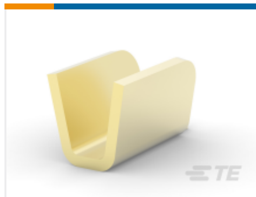
TE 产品编号 62306-1 SPLICE, AMPLIVAR