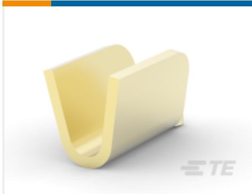
TE 产品编号 62040-2 SPLC AMVAR 1500-5000 .020BR