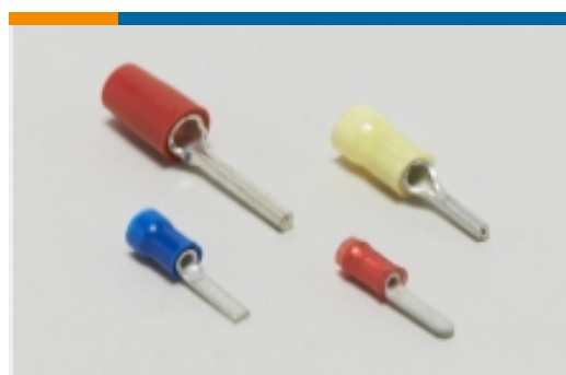
压接电线插针、公端和插针(5)