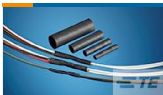
TE 产品编号2525596021 RBK-ILS-125-NR1-0-30MM