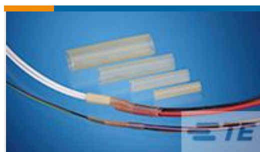
TE 产品编号CH07756001 DSPL-NR1-X-70MM