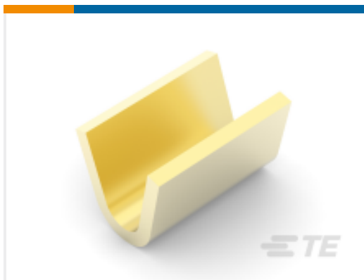
TE 产品编号 280007-1 AMPLIVAR SPLICE PLAIN