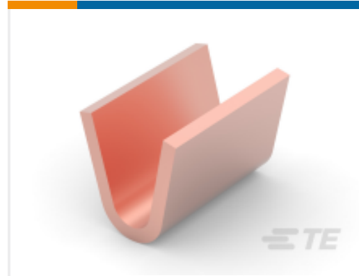
TE 产品编号 964156-1 AMPLIVAR-VERBINDER